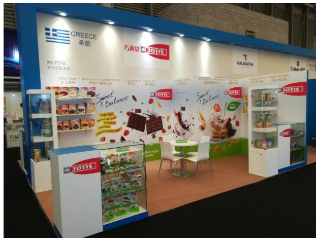
SIAL CHINA 2018

Η συμμετοχή της GREAT GREEK EXPORTS AND TRADE και για το 2018 στέφθηκε με απόλυτη επιτυχία, με την εταιρεία μας να διοργανώνει μια άρτια παρουσία, με αναβαθμισμένες ξύλινες κατασκευές, γραφικά, πλούσιο φωτισμό και έντονη σήμανση της Ελλάδας και διακριτική εταιρική σήμανση.