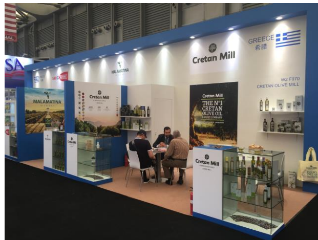
SIAL CHINA 2018

Οι εκπρόσωποι των συμμετεχουσών εταιρειών δήλωσαν πολύ ικανοποιημένοι τόσο από την επισκεψιμότητα όσο και από την ποιότητα των συναντήσεων που είχαν κατά τη διάρκεια της έκθεσης, επιβεβαιώνοντας για ακόμα μια φορά την επιλογή τους για σταθερή και διαχρονική συμμετοχή τους στην έκθεση. Το ενδιαφέρον για τα ελληνικά προϊόντα ήταν ιδιαίτερα υψηλό και φέτος, με τους Έλληνες εκθέτες να πραγματοποιούν εκατοντάδες επαφές και αρκετοί από τους εκθέτες έχουν ήδη προχωρήσει σε εμπορικές συμφωνίες.