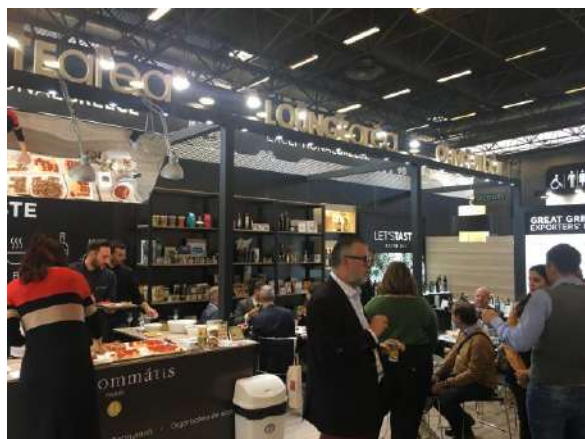
Taste Area Sial Paris 2018

Γνωστοί chefs θα δημιουργήσουν εξαιρετικές και ποιοτικές γαστρονομικές προτάσεις προβάλλοντας τον ελληνικό πλούτο των προϊόντων και ενισχύοντας την παρουσία των εκθετών μας.