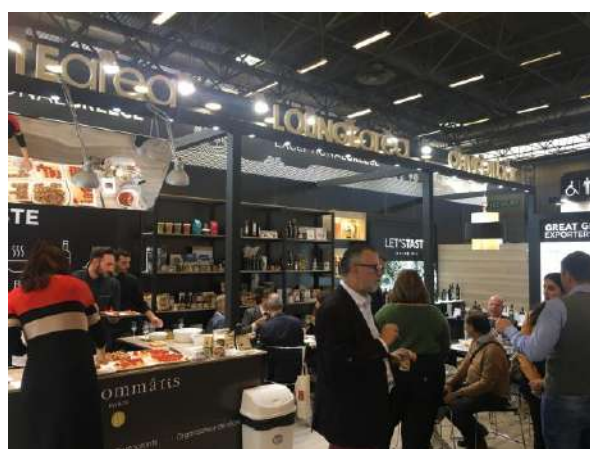
Table de la Méditerranée , που δραστηριοποιείται με μεγάλη επιτυχία στο χώρο της δημιουργικής κουζίνας 35 χρόνια στο Παρίσι. Όλοι οι επισκέπτες έμειναν ενθουσιασμένοι από τον πλούτο της ελληνικής γαστρονομίας, των ποιοτικών και διαφορετικών συνταγών, αλλά και της εκλεπτυσμένης παρουσίασης των προϊόντων. Στο χώρο του Taste Area υπήρξε επίσης εκθετήριο των προϊόντων των συμμετεχουσών εταιρειών.