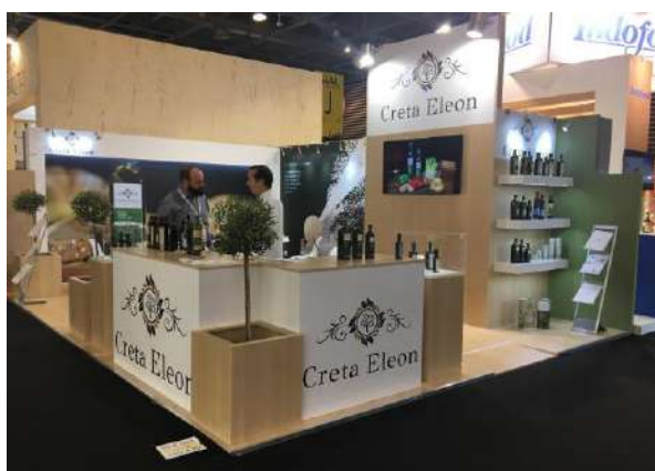
SIAL PARIS 2018 Custom Made κατασκευή