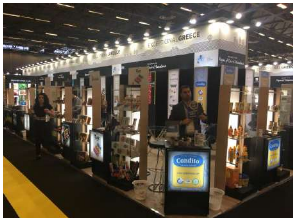
SIAL PARIS 2018 Περιφέρεια Κεντρικής Μακεδονίας