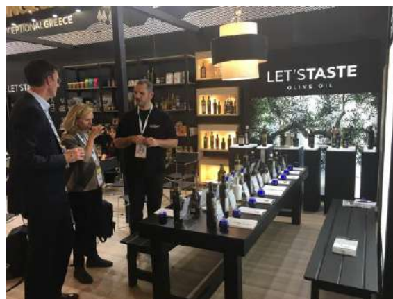
Olive Oil Bar Sial Paris 2018