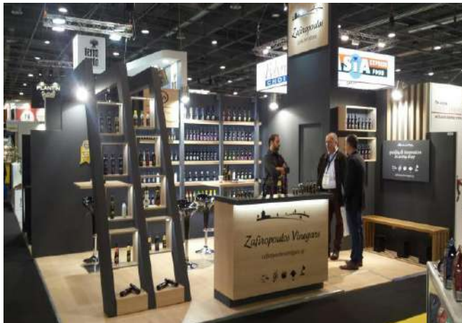
SIAL PARIS 2018 Custom Made Κατασκευή

Η GREAT GREEK EXPORTS AND TRADE για τρίτη συνεχόμενη χρονιά οργάνωσε μία άρτια και καλοσχεδιασμένη εκθεσιακή παρουσία για τους Έλληνες εκθέτες που ξεχώρισε μέσα από δεκάδες συμμετοχές χωρών απ' όλον τον κόσμο και τράβηξε την προσοχή πλήθους επισκεπτών που πλημμύρισαν τα περίπτερά της. Η παρουσία των Περιφερειών αλλά και των μεμονωμένων εκθετών γειτνίαζε με την Ιταλική συμμετοχή και κέρδισε τις εντυπώσεις όχι μόνο για την αισθητική, αλλά και για τον πλούτο των προϊόντων τους. Οι εκθέτες της GREAT GREEK EXPORTS AND TRADE πραγματοποίησαν ικανοποιητικό όγκο συναντήσεων, ενώ εμπορικές επαφές και συμφωνίες ήρθαν να επισφραγίσουν την επιτυχία της συμμετοχής τους.