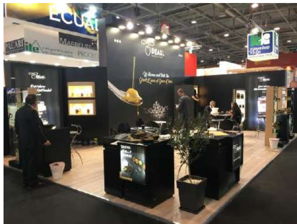
SIAL PARIS 2018 Ομαδικού τύπου κατασκευή