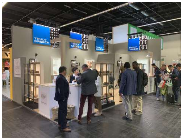
Νέα κατασκευαστική μας πρόταση