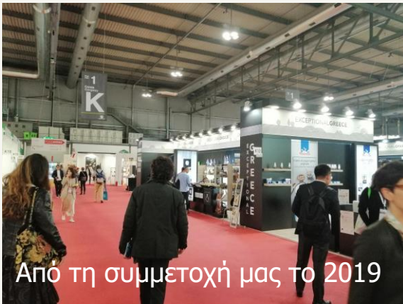
Από τη συμμετοχή μας το 2019

η HOST , μια από τις μεγαλύτερες εκθέσεις του κλάδου HORECA και η MEAT-TECH , κορυφαία έκθεση για τη συσκευασία και επεξεργασία κρέατος και έτοιμων γευμάτων.