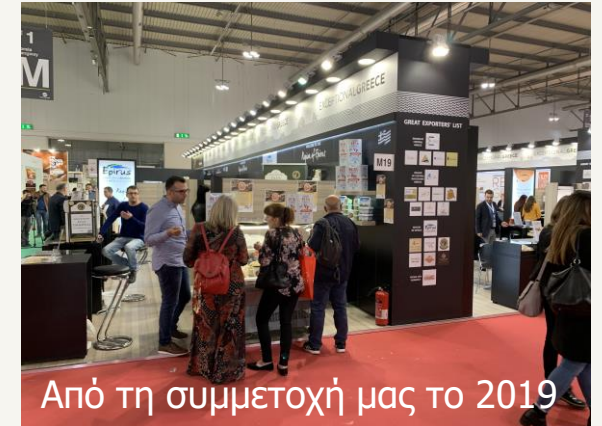
Από τη συμμετοχή μας το 2019