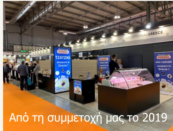
Από τη συμμετοχή μας το 2019