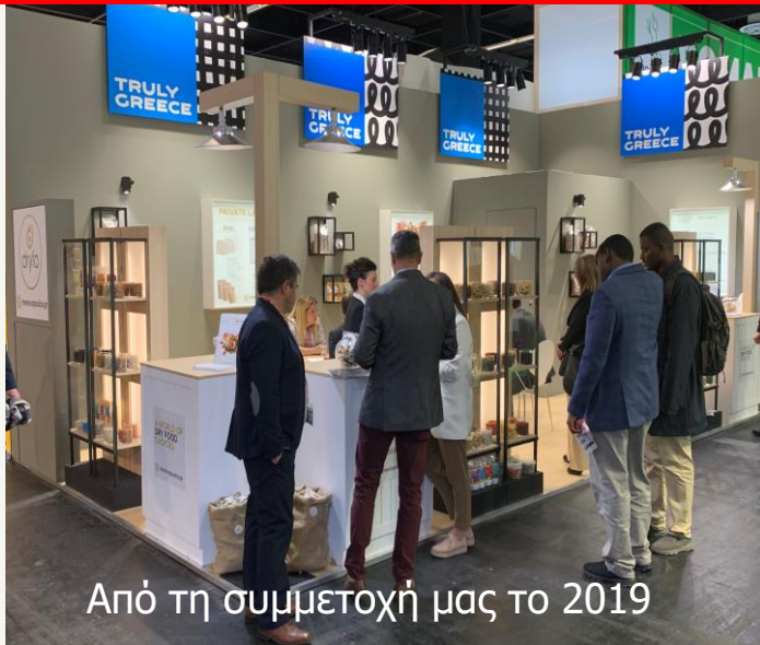
Από τη συμμετοχή μας το 2019

Registration fee → 555 € που περιλαμβάνει και την υποχρεωτική ασφάλεια