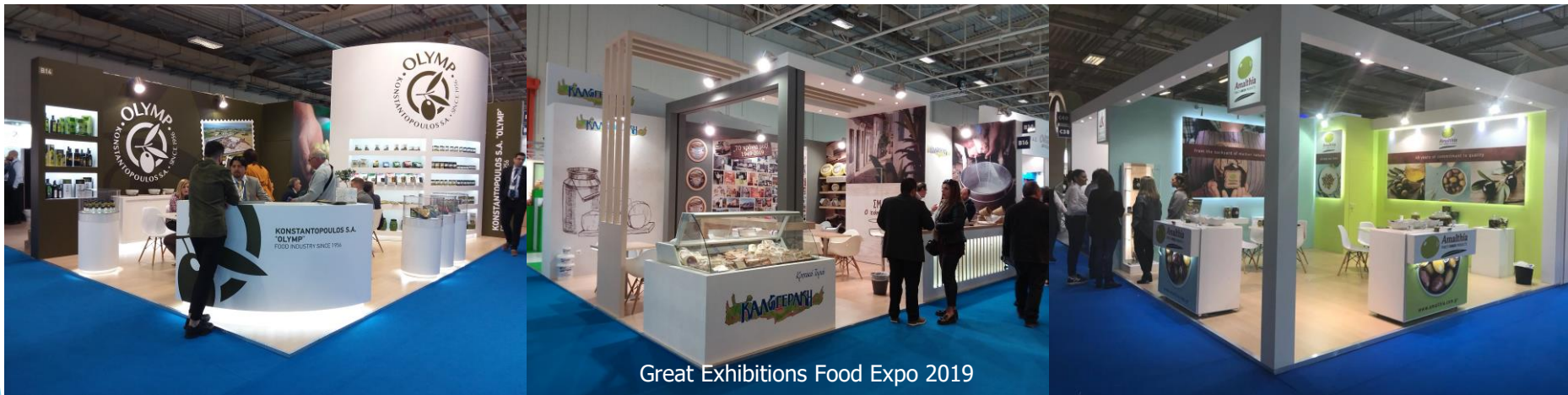
Great Exhibitions Food Expo 2019

από τις 12 έως τις 14 Μαρτίου 2022 στην Αθήνα, στο εκθεσιακό κέντρο Athens Metropolitan Expo , με προτάσεις σε όλα τα Halls της έκθεσης.